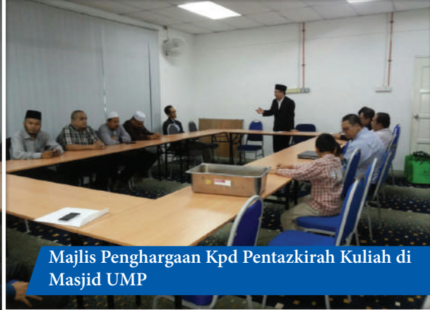
Majlis Penghargaan Kpd Pentazkirah Kuliah di Masjid UMP