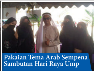
Pakaian Tema Arab Sempena Sambutan Hari Raya Ump