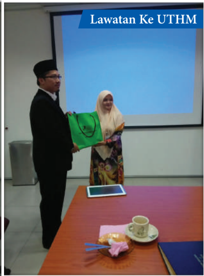
Lawatan Ke UTHM