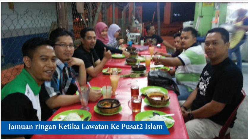
Jamuan ringan Ketika Lawatan Ke Pusat2 Islam