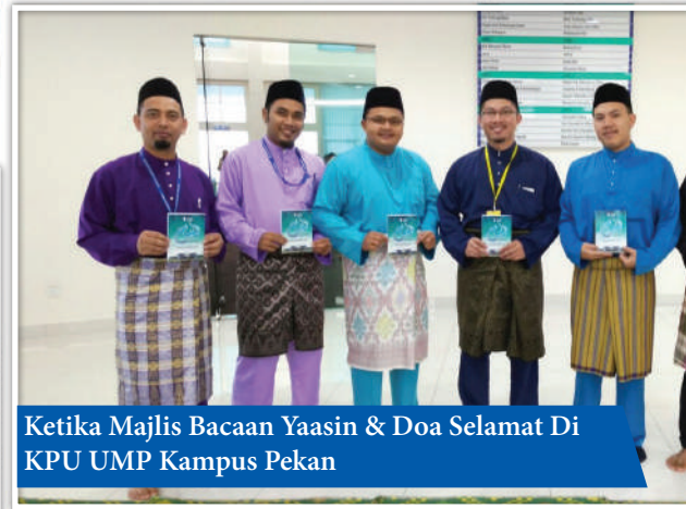
Ketika Majlis Bacaan Yaasin & Doa Selamat Di KPU UMP Kampus Pekan