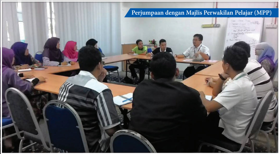
Perjumpaan dengan Majlis Perwakilan Pelajar (MPP)