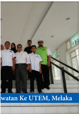
Lawatan Ke UTEM, Melaka