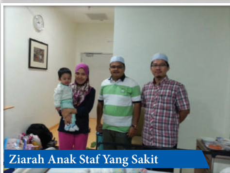
Ziarah Anak Staf Yang Sakit