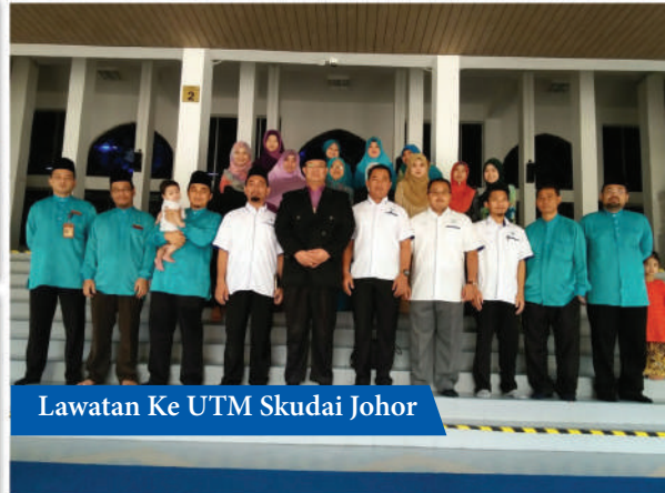
Lawatan Ke UTM Skudai Johor