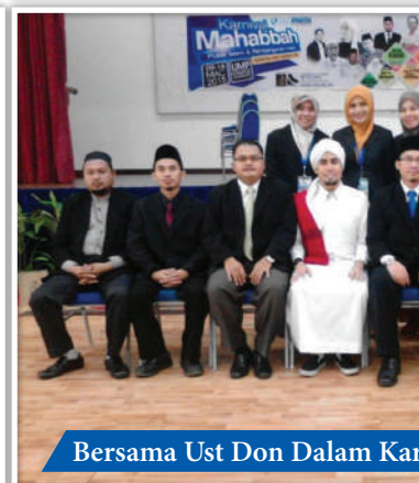
Bersama Ust Don Dalam Kar