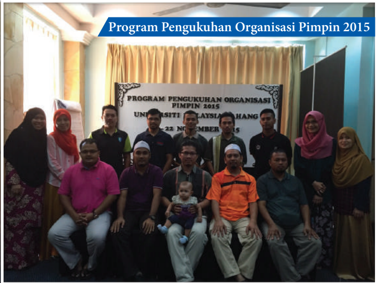
Program Pengukuhan Organisasi Pimpin 2015