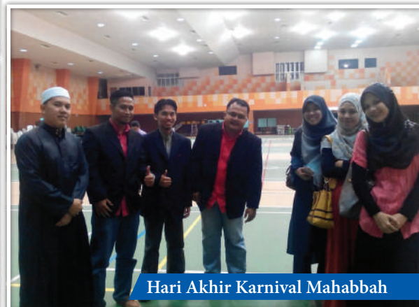
Hari Akhir Karnival Mahabbah