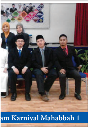
Am Karnival Mahabbah 1