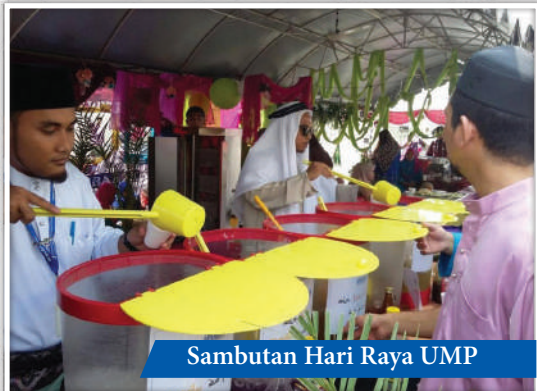
Sambutan Hari Raya UMP