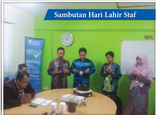
Sambutan Hari Lahir Staf