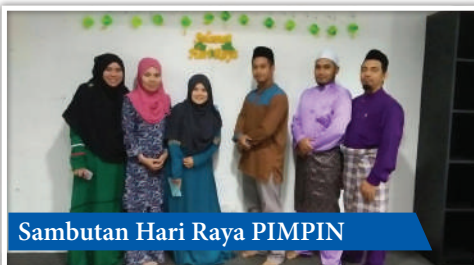
Sambutan Hari Raya PIMPIN