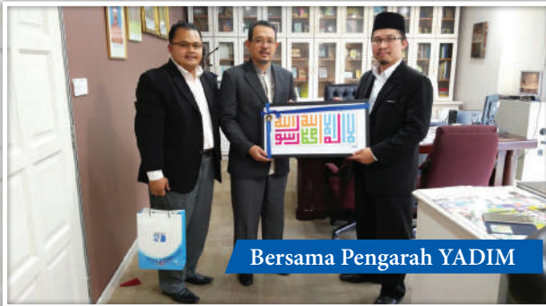
Bersama Pengarah YADIM