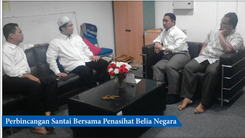
Perbincangan Santai Bersama Penasihat Belia Negara