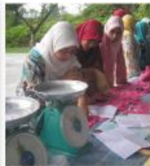
Pelajar SQA Menggahikan daging korban UMP1. Digah-ghikan kepada Mesyuarat Yang Laks dan Jabatan Sekitar Kampus UMP.