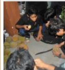
Peserta Revolving SQA's Camp persembahkan Merit dan Buah Daun bersekolah baru Di Jabatan Di Rusa, Pahang.