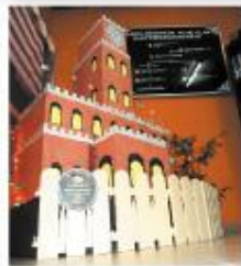
PIMPIN turut menyerta pertandingan bersepadu Hal bersekolah 50-50 yang bersekolah bangunan Sultan Abdul Rozak.