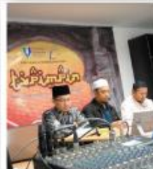
Tv PIMPIN Rancangan Secara Langsung Dengan Program Taklimat Al-Quran Dan Isytihar sepanjang Ramadhan.