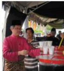
Y. Ling Dato, N.C. Mesyuarat Moad Wang yang di Selai PIMPIN Semasa Sumbuh Hari Raya Aidilfitri Pengkat Ulu.