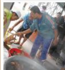
Pada Peserta Berpeluang Madaikan Anad Dalam Kruva Anak Bersekolah.