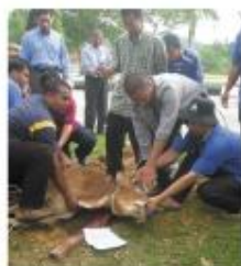
Isytihar Korban Sabon Tahun Dilaksanakan Dengan Jajanya yang Diwarta Oleh Staf UMP.