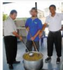
Staf PIMPIN Dan Chef Kanan Menyediakan Bubur Kasang Pada Setiap Hari Jumaat.