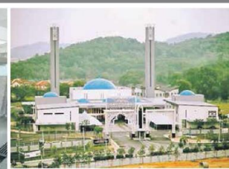
BEGINILAH keindahan Masjid Puncak Alam, Selangor yang berseni bina moden.