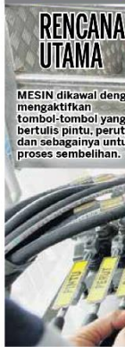
MESIN dikawal dengan mengaktifkan tombol-tombol yang bertulis pintu, perut, leher dan sebagainya untuk proses sembelihan.