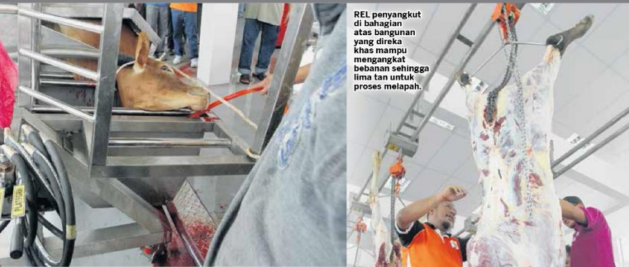
REL penyangkut di bahagian atas bangunan yang direka khas mampu mengangkat bebanan sehingga lima tan untuk proses melapah.