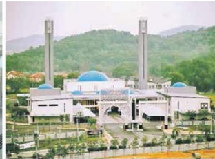
BEGINILAH keindahan Masjid Puncak Alam di Puncak Alam, Selangor yang berseni bina moden.