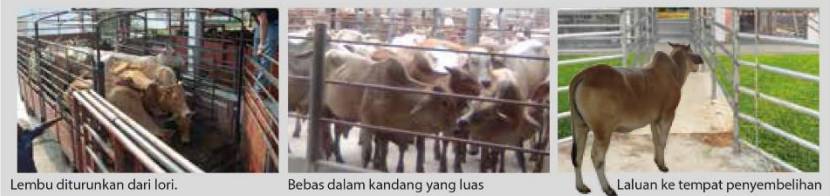
Lembu diturunkan dari lori. Bebas dalam kandang yang luas. Laluan ke tempat penyembelihan