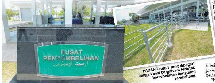
PADANG ragut yang dipagari dengan besi bergalvani terletak bersebelahan bangunan sembelihan.